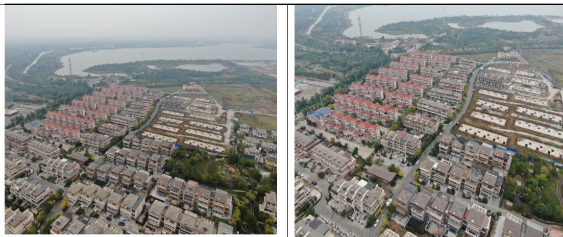
图 4.1-1 项目现场情况